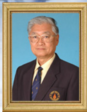
นายกสภา มหาวิทยาลัยมหิดล