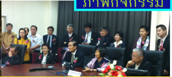
ประธานสภาคณาจารย์ร่วมเยี่ยมชื่นชม มหาวิทยาลัยมหิดล วิทยาเขตอานาจเจริญ ร่วมกับกรรมการสภามหาวิทยาลัย