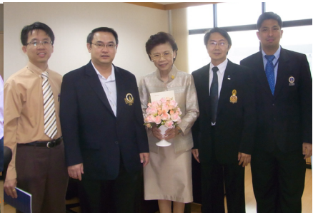
ผู้บริหารสภาคณาจารย์เข้าพบรองอธิการบดีฝ่ายต่างๆ เพื่อแสดงความยินดีและสวัสดีปีใหม่