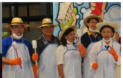
ประธานสภาคณาจารย์ ร่วมกิจกรรม “น้ำลดไม่หมดรัก ร่วม Clean up ศาลายา” ร่วมฟื้นฟูและทำความสะอาดพื้นที่หลังเหตุการณ์น้ำท่วมครั้งใหญ่