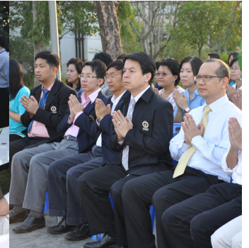
สมาชิกสภาคณาจารย์และเจ้าหน้าที่ร่วมงานพิธีทำบุญตักบาตรเนื่องในวันปีใหม่ พ.ศ. 2555 ณ บริเวณลานมหิดล มหาวิทยาลัยมหิดล ศาลายา