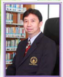
อ.ราชา มหาเก็นธา วิทยาลัยการจัดการ