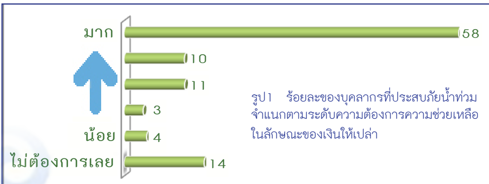
รูป 1 ร้อยละของบุคลากรที่ประสบภัยน้ำท่วม จำแนกตามระดับความต้องการความช่วยเหลือในลักษณะของเงินให้เปล่า

ทั้งนี้บุคลากร ร้อยละ 42 ของผู้ตอบแบบสอบถาม มีความต้องการมากที่สุดในการที่จะให้มหาวิทยาลัยจัดหาช่างไฟ ช่างประปา ช่างสี ช่างก่อสร้าง เพื่อช่วยซ่อมแซมบ้าน ( ดังแสดงในรูป 2 ) ร้อยละ 40 ต้องการการดูแลจากผู้บริหารส่วนงาน