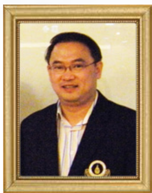
ประธานสภาคณาจารย์ มหาวิทยาลัยมหิดล