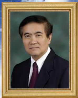
อธิการบดี มหาวิทยาลัยมหิดล

ISSN 0857-989 x ปีที่ 38 ฉบับ มกราคม - กุมภาพันธ์ พ.ศ. 2555